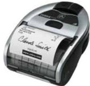
(الصورة توضيحية فقط)